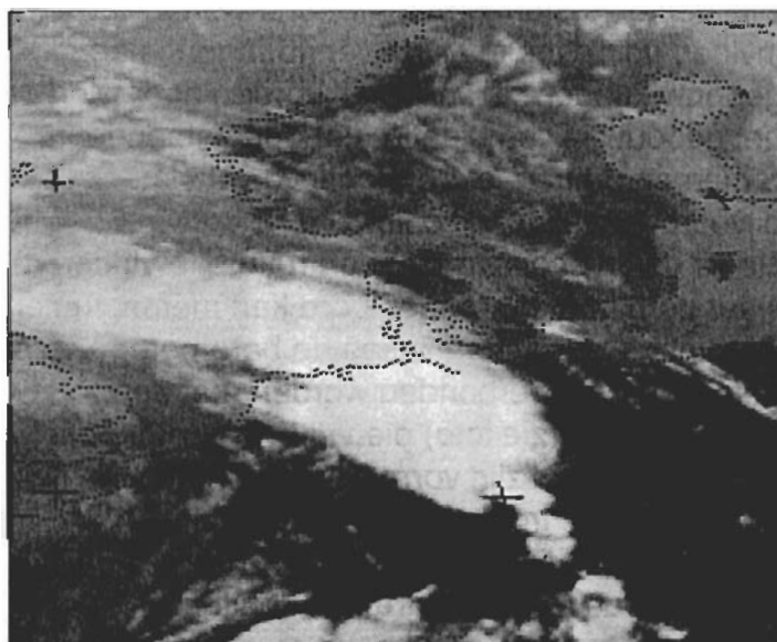
Figuur 2. Satellietfoto (MET-5, IR) van een squall line. 4 juli 1994, 14.30 UTC. ►