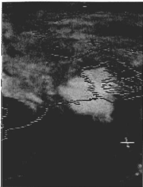
Figuur 3. Satellietfoto (MET-5, IR) van een cloud cluster. 29 juni 1994, 7.30 UTC.

complex ontstaat, al vaak 's middags ontstaan. Ook is het zo, dat het complex in veel gevallen buiten Nederland, vaak in Frankrijk, gevormd wordt om dan vervolgens naar Nederland te trekken. In tegenstelling tot cloud clusters vertoont het voorkomen van squall lines geen dagelijkse gang! Een verklaring voor dit verrassende resultaat kan zijn dat de vorming van squall lines sterk gekoppeld is aan processen in de bovenlucht, die zich in eerste instantie ook niet door de dagelijkse gang laten leiden. De gemiddelde duur van een MCS in Nederland bedraagt 6,7 uur. Dit is niet de totale levensduur van het systeem, daar het vaak al buiten Nederland ontstaan is en ook na het voorkomen boven Nederlands grondgebied nog actief is.