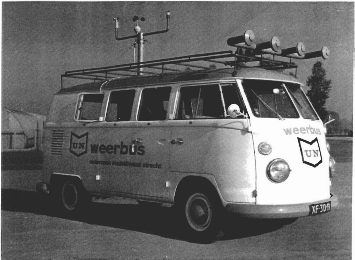
Meetbus van het IMOU bracht begin 70-er jaren Utrechts stadsklimaat in kaart