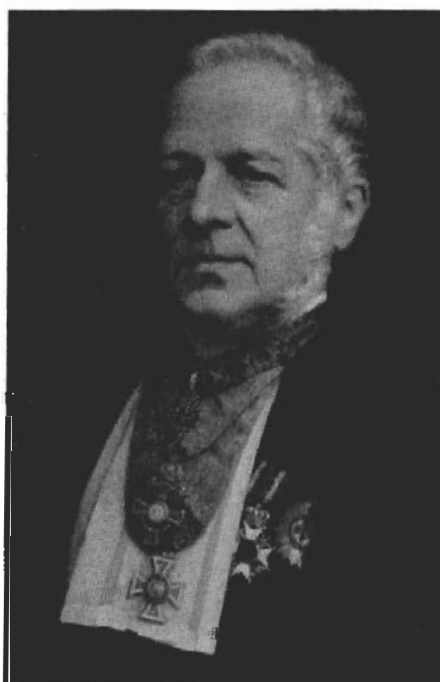
Prof. Dr. C.H.D. Buys Ballot

Het vakgebied meteorologie is al langer dan 25 jaar vertegenwoordigd aan de RUU. De kiem werd gelegd in 1854 door C.H.D. Buys Ballot, toen hij buitengewoon hoogleraar in de wiskunde aan de RUU was. In dat jaar richtte hij het KNMI op en kon daarbij rekenen op