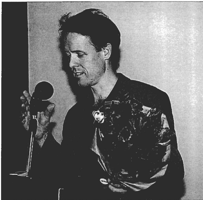
De scheidende hoofdredacteur.

Jazeker, ik zag dit als een bevestiging van