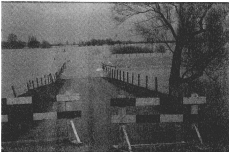
"Maart belangrijk natter"

echter de enige zomermaand waarin het gemiddelde luchtdrukkniveau naar beneden ging. Juni bepaalde bij de overige weersfactoren in hoofdzaak het beeld van de gehele zomer, waardoor ten onrechte een slecht gemiddeld beeld van de zomer ontstond. We kunnen juni beter aansluiten bij de lente.