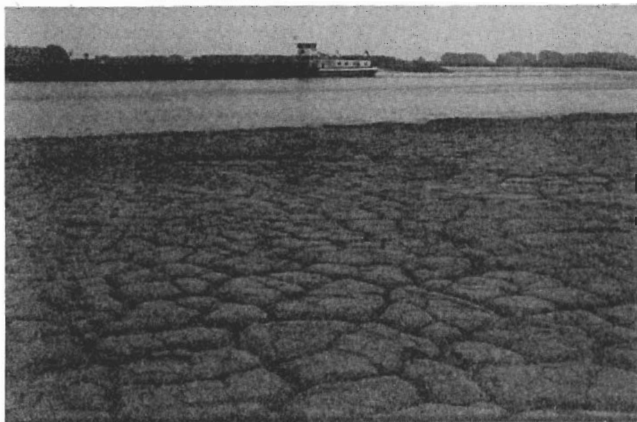
"Augustus een stuk droger"

en december wat in overeenstemming is met de gemiddeld toegenomen neerslaghoeveelheid (en misschien ook met de toename van de hoeveelheid zonneschijn: minder hogedruksituaties dus minder mist?).